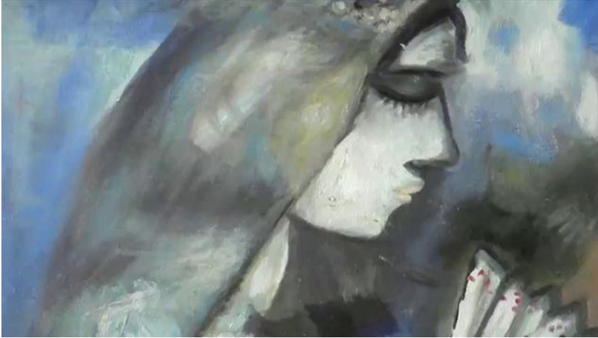
The Persistent Widow – La Viuda Persistente / Art by Parabelproject.nl