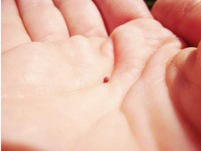
Mustard Seed – Semilla de Mostaza