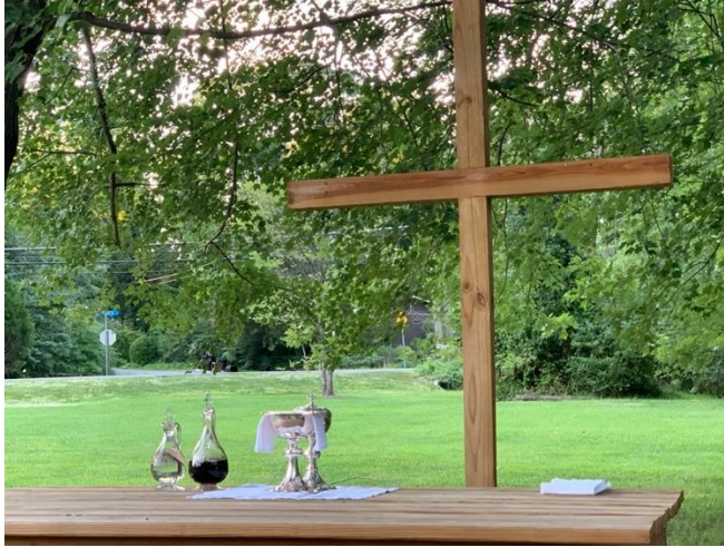
Outdoor Chapel – Capilla al Aire Libre