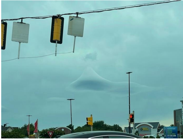
Curious cloud formation. Dranesville, Va. – Curiosa formación de nubes. Dranesville, Va. June 22, 2021