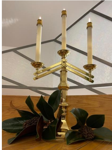
Candlestick On The Altar – Candelabro En El Altar