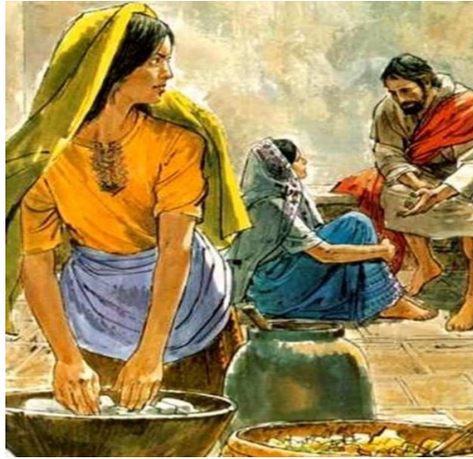
Mary & Martha – Maria y Marta