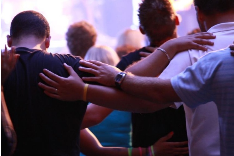
"That they may all be one..." John 17:21/ "Te pido que todos ellos estén unidos..." Juan 17:21