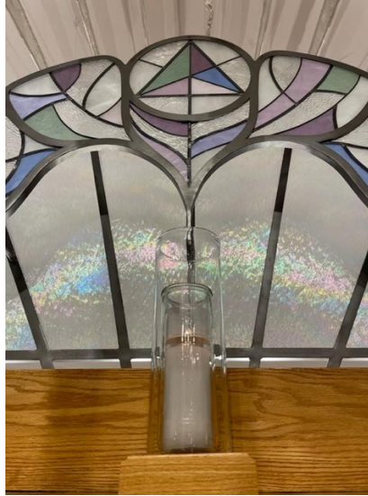
Candle On The Altar/ Vela En El Altar