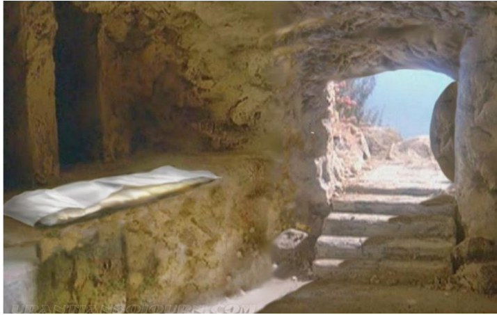
Empty Tomb / Tumba Vacía