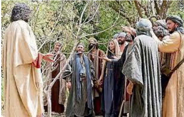
The Parable of the Barren Fig Tree / La Parábola de la Higuera