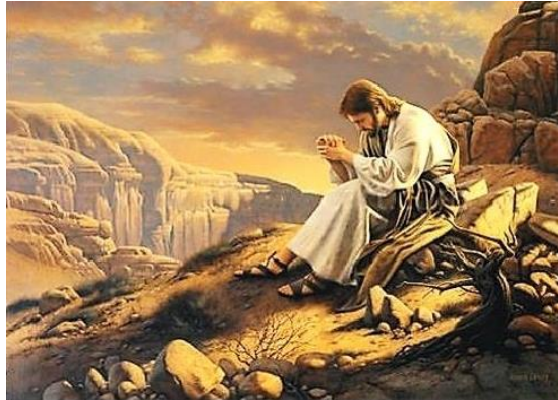
Jesus is Tempted to Abandon Serving God / Jesús en el desierto.