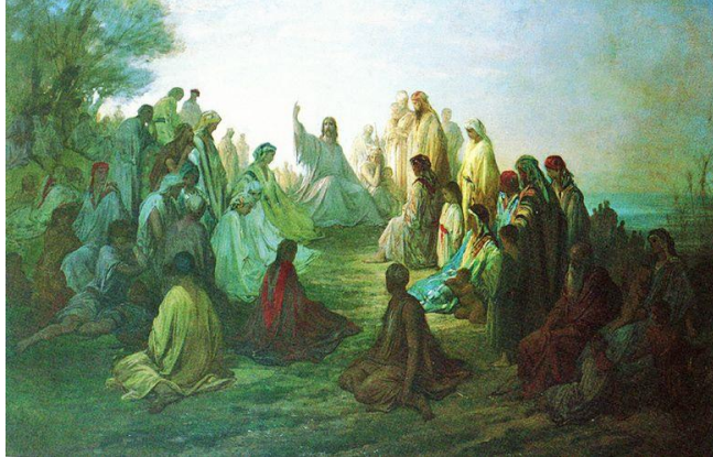
Blessings and Woes / El Sermon del Monte