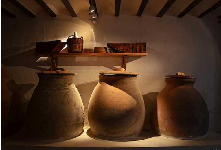
Clay jars / Tinajas de barro