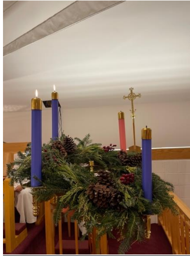
Advent Wreath / Corona de Adviento