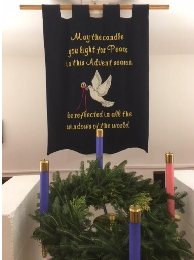
Advent at Saint Timothy's / Tiempo de Adviento en Saint Timothy's