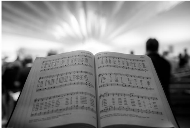
Craig Dubishar, Fotógrafo